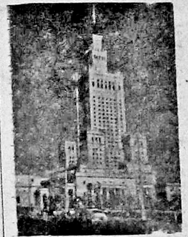
Столица Польской Народной Республики — Варшава. Дворец культуры и науки имени И. В. Сталина.

Все это говорит о том, что за наведение чистоты и порядка должны бороться не только руководители, но и каждый рабочий. Только общими усилиями можно в короткий срок решить эту неотложную задачу.